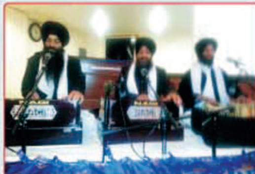
ਗੁਰੂਘਰ ਦਾ ਹਜੂਰੀ ਰਾਗੀ ਜਥਾ

ਗੁਰੂ ਦੇ ਲੰਗਰਾਂ ਦੀ ਸੇਵਾ ਕਰਨ ਲਈ ਅਤੇ ਸਟਾਲ ਲਗਾਉਣ ਲਈ ਸੰਪਰਕ ਕਰੋ ਬੀਬੀ ਸਰਬਜੀਤ ਕੌਰ 209 430 9415 ਸ. ਜਸਵਿੰਦਰ ਸਿੰਘ ਤੂਰ 209 470 6881